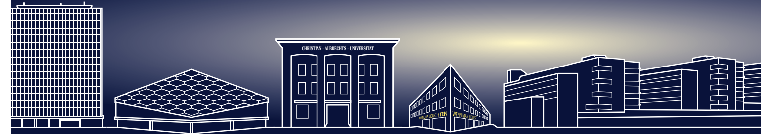
Grafik: Universitätsdruckerei der CAU

* Das Vorhaben wird aus Mitteln des Bundesministeriums für Bildung und Forschung unter dem Förderkennzeichen 01PL17068 gefördert. Die Verantwortung für den Inhalt liegt beim Autor.